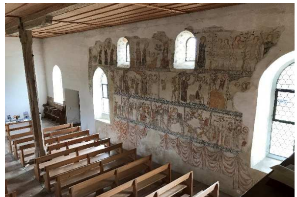
Bestandsanalyse in einem Kirchenraum