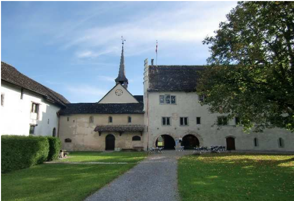
Klimamessungen im Ritterhaus Bubikon