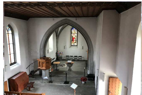
Messungen und Auswertungen bezgl. Pilzbefalls

Wir unterstützen Sie kompetent bei der Entwicklung von massgeschneiderten Lösungen für Ihr Gebäude.