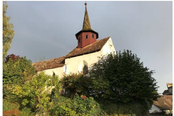
Ermittlung des Ist-Zustands aussen und innen