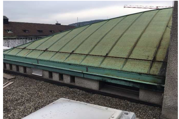
Simulationen an denkmalgeschütztem Kupferdach