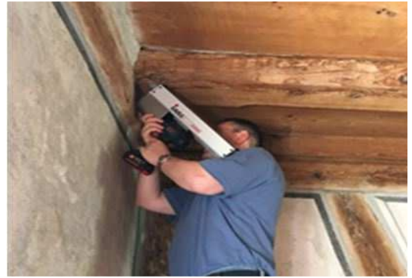
Bohrwiderstandsmessungen an Holz Deckenbalken