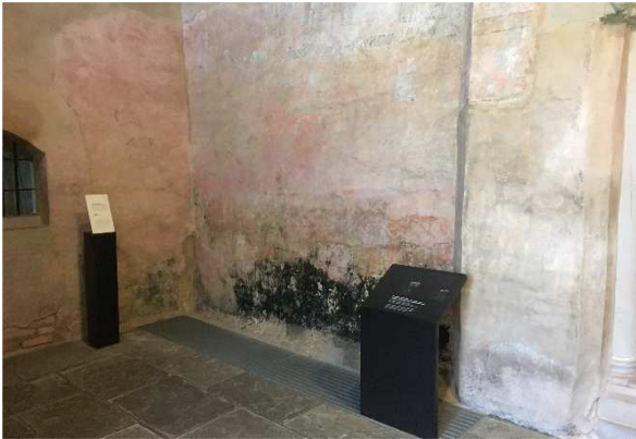
Untersuchung von Bakterien- und Algenbefall