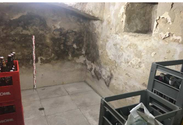
Schimmel und Salzausblühungen in einem Keller