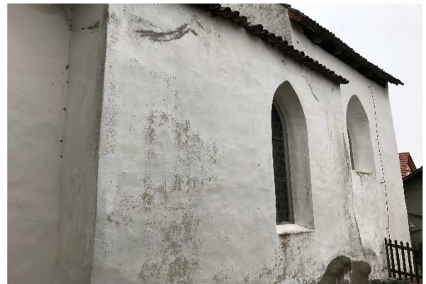
Sanierungsplanung beschädigter Putze und Anstriche

Wir unterstützen Sie kompetent bei der Entwicklung von massgeschneiderten Lösungen für Ihr Gebäude.